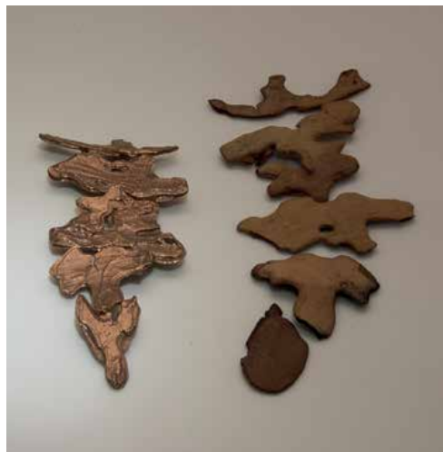
PONDEROSA PUZZLE 2017

In 2016, her work was shown at the Pôle Bijoux BACCARAT, The Belgrade City Museum, the Carrousel des Métiers d'Art - Louvre Carrousel Paris during the European Days of Craft Design and the Gallery Clé, as well as "Terres de Voyages" in Galerie des Créateurs in Touques.