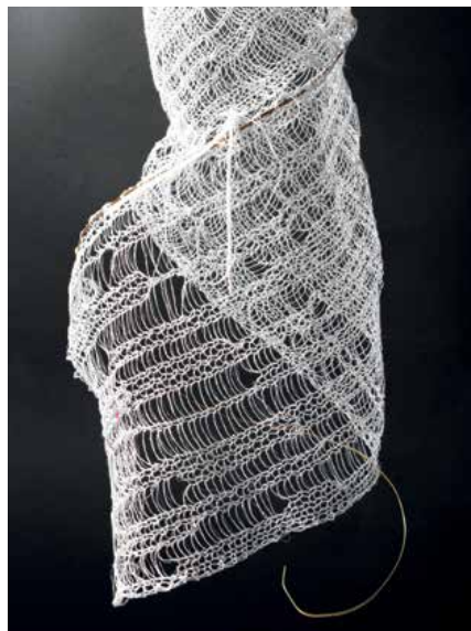
FEEDER ROOTS 2017

Diana je še posebej občutljiva na igro svetlobe in luminoznosti, v kateri je odraščala, in ki še vedno ostaja prisotna v njenem vsakdanjem življenju. Njen pristop odraža to fascinacijo. V svojem najnovejšem delu je izvedla vrsto vzorcev, ki raziskujejo usmerjene učinke osvetlitve in osvetlitve ozadja na mreže, spletene iz najlonskih ali kovinskih niti. Ročne pletilne stroje in industrijske materiale uporablja na izvirne načine, jemajoč jih iz njihovih prvotnih kontekstov, s čimer raziskuje različne materiale in tehnike. V svojem ustvarjalnem procesu raziskuje metamorfizme, napetosti, valovanja, elastičnost in raztezanje, ki so značilni za tehniko pletenja, in jih povezuje z različnimi lastnostmi in mešanici platna, emajliranega bakra, nerjavečega jekla in najlonskih niti. Projicirana svetloba ustvarja atmosfero njenim inštalacijam in je pri njenih zadnjih delih celo neposredno vključena v formo. Iz teh raziskav so vzniknili velika in majhna dela.