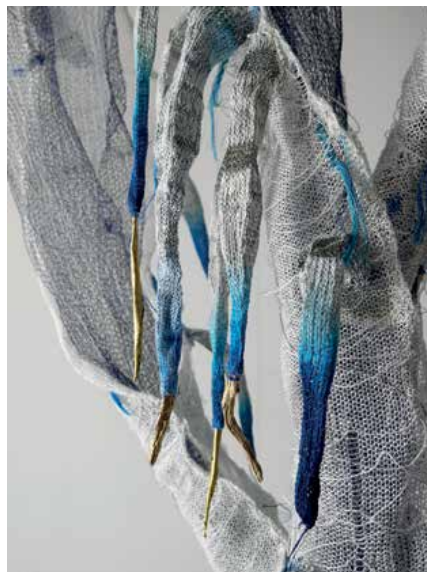
PAPAVER SETIGERVUM ROOTS 2017