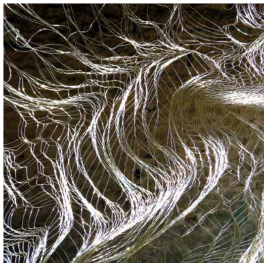
FIGURE 1 2017

Njene lahke, prozorne inštalacije se poigravajo v mejah med prožnostjo in togostjo, nihajo med zapeljevanjem in izzivanjem, ustvarjajoč bežne paradoksalne prostore. Naj bodo to paсти ali darovi, umetnica črpa v luči minljivih odmikov, s čimer začrta napetosti, ki obstajajo med realnostjo in fikcijo. Če jih vzamemo iz njihovih prvotnih dekorativnih ali industrijskih kontekstov, so materiali banalni, vsakodnevni. Geste so preproste, ponavljajoče se in oblike so osnovne, toda prisotnost struktur spremeni občutek dojemanja v znanem okolju, vendar le za čas trajanja razstave.